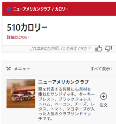
Yext Answersによるサイト内検索結果イメージ

お客様の意図に対して的確かつ、+αの気づきの情報も関連づけた価値の高い情報を表示可能に