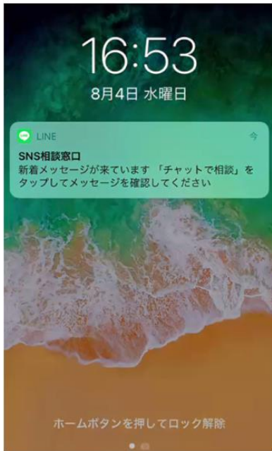
スマートフォンにLINEアプリのプッシュ通知が表示