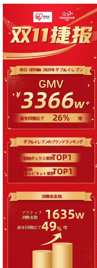
日本の家庭用品ブランド IRIS OHYAMA のダブルイレブンの実績

また、トランスコスモスチャイナの「Uni Marketing」チームは、データに基づいた消費者オペレーションと高精度のマーケティングサービスを通じ、スポーツ・アウトドア(ANTA)、ファッションシューズ(TATA)、家庭用品(MDZF SWEETHOME、HOTATA、IRIS OHYAMA)などの業界でのトップブランドの業務拡大の実現を支援しました。このうち、日本の家庭用品ブランド IRIS OHYAMA(アイリスオーヤマ)のアクティブユーザーは前年比で 49% 伸長し、GMV が 3,336 万元(1 元 15.92 円換算で約 5 億円)を超え、前年比 26% 伸長しました。