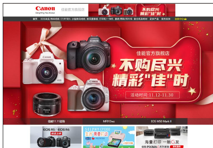
TMALL「Canon 公式旗艦店」(URL: https://canon.tmall.com/ )