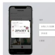
多彩なプッシュ通知