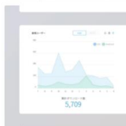
高度なデータ分析