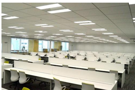
オペレーションルーム

ファシリティ面では、オペレーションルームはガラス張りの開放的な空間になるよう設計しました。携帯ロッカーを設置したユーティリティスペースと直結し、すぐに休憩がとれる導線となっています。また、生体認証設備を導入しカードレスを実現したことから、高セキュリティを担保しています。