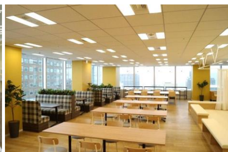
リフレッシュルーム