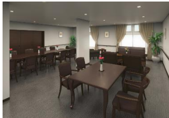
<コミュニティラウンジ(イメージ)>