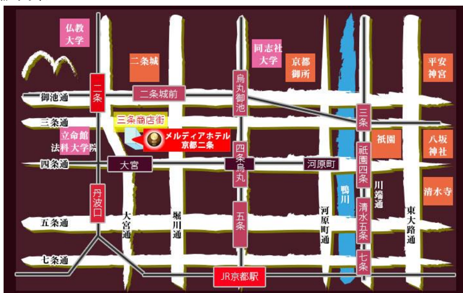
（最寄り駅からの地図）