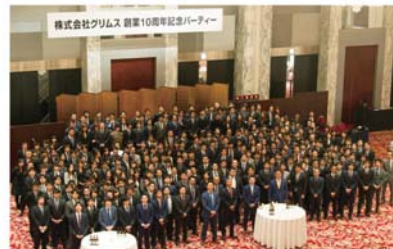
創立10周年記念式典

グリスソーラー懐山太陽光発電所 (静岡県浜松市 1,344kW) 2016年5月運転開始