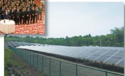
太陽光発電所建設計画イメージ