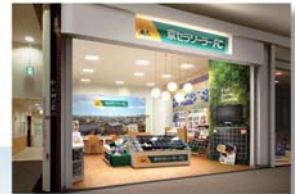
京セラソーラーFC (イメージ)

9月 第三者割当により新株式を発行(423百万円を調達) 株式会社エナリスに対して普通株式388,200株を1株につき1,090円で 割当、増資を実施