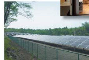
嬭恋鎌原立野 メガソーラー発電所