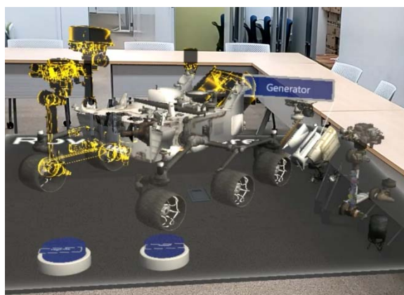
MR 技術を用いた仮想オブジェクト