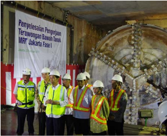
貫通したシールド 2 号機の前であいさつされるジョコ・ウィドド大統領（前列中央）