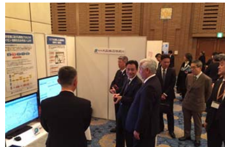
[同社出展ブースでの中谷元前防衛大臣]