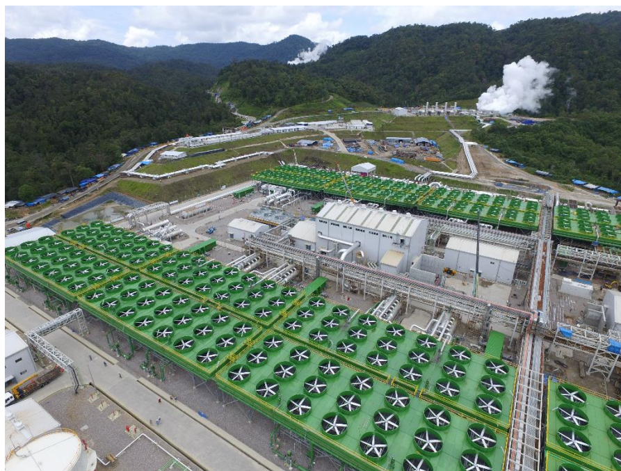
第 2 号機の商業運転開始の様子

（※3）2017 年 3 月 22 日付で公表： http://www.inpex.co.jp/news/pdf/2017/20170322_a.pdf